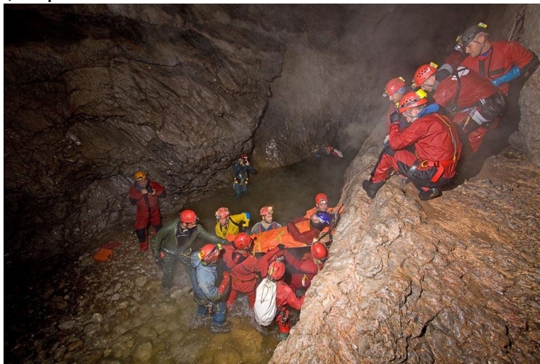
Exercițiu internațională la Cetățile Ponorului – Munții Bihor

O echipă a formației Salvamont - Salvaspeo Mureș a participat la exercițiul de simulare a unui accident speologic, organizat de CORSA, cu participare internațională, care s-a desfășurat la peștera Cetățile Ponorului, în perioada 10 – 11 iulie 2010