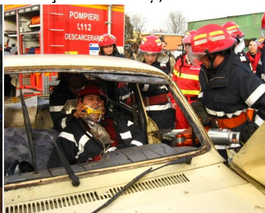
Curs de paramedic la IGSU Tg Mureș