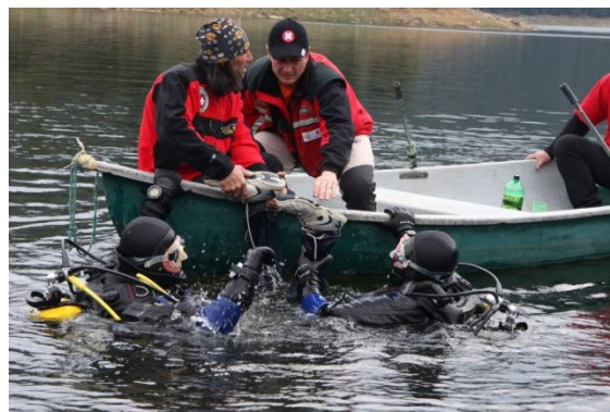
Colaborare cu IGSU pentru recuperarea victimelor înotătoare