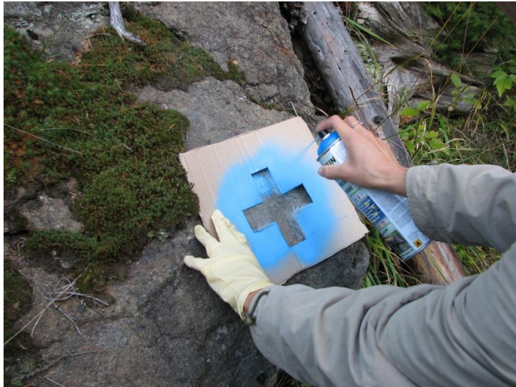
Marcarea treseelor turistice