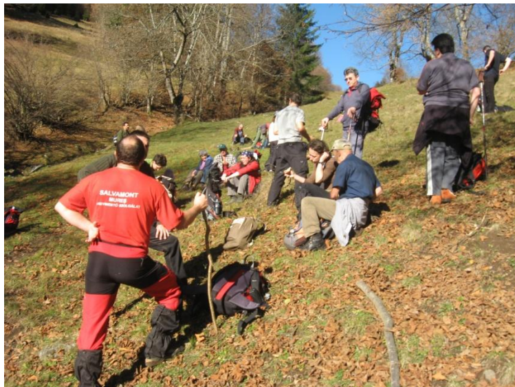
Prezentarea potențialului turistic al județului