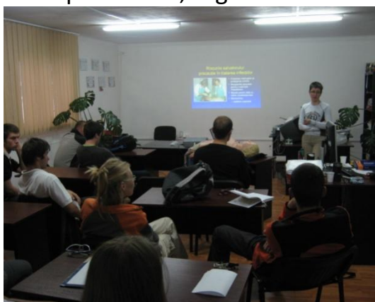
Curs de prim-ajutor la SPJ Salvamont