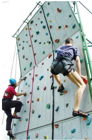
Zilele Muntelui – concurs de cățărare