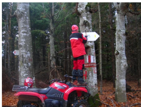
Patrulări preventive și verificarea indicatoarelor