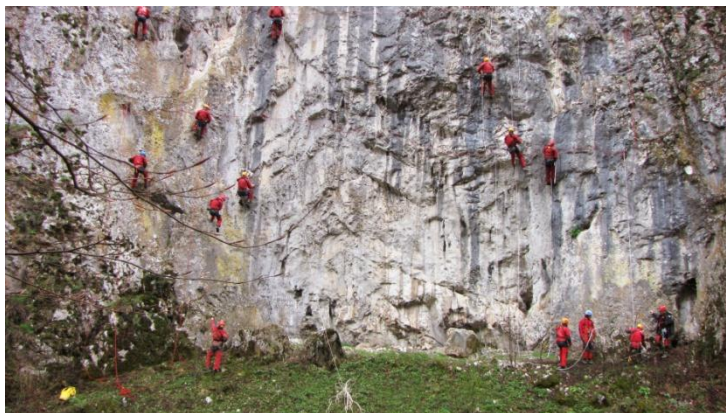
Antrenament pe faleză